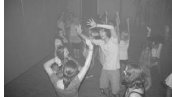
Jugend-Disco am Freitag

Am 28. August 2011 feierten wir mit einem Gottesdienst und dem anschließenden Gemeindefest den 50. Geburtstag unserer Christuskirche. Hier zeigen wir Ihnen ein paar Bilder von diesem Fest.