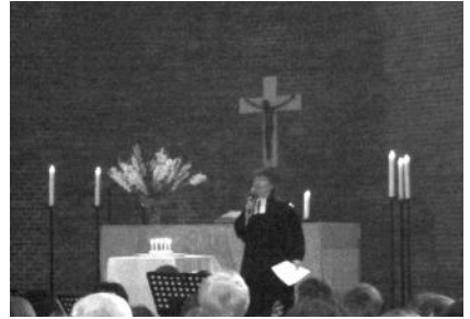
Die Kinder der KITA tragen den Geburtstagskuchen an den Altar.