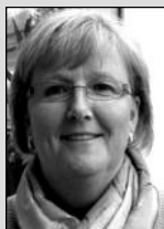
Kindertagesstätte Brigitte Simmerock Tel.: 52642

Öffnungszeiten des Gemeindebüros: Mo, Di, Do, Fr von 10 - 12 Uhr Mi von 15 - 18 Uhr