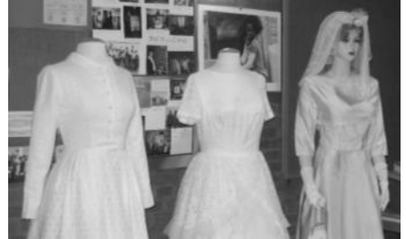
Am 27. August fand der Trau-Erinnerungsgottesdienst statt.