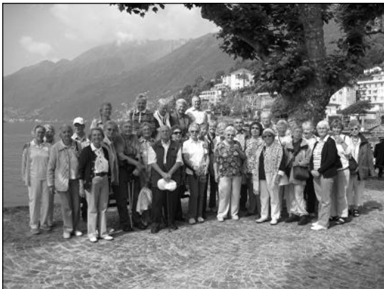
Teilnehmer der Freizeitfahrt, in Ascona aufgenommen.

Ein anderer Ausflug führte uns zum Orta-See, westlich des Lago Maggiore gelegen und dort nach Orta mit der vorgelagerten Isola San Giulio.