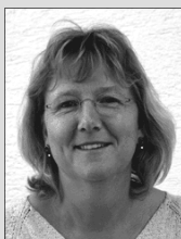
Kindertagesstätte Brigitte Simmerock Tel.: 52642