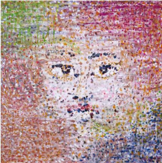
Herr K., Acryl auf Leinwand 2011